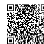
こども系・親子系